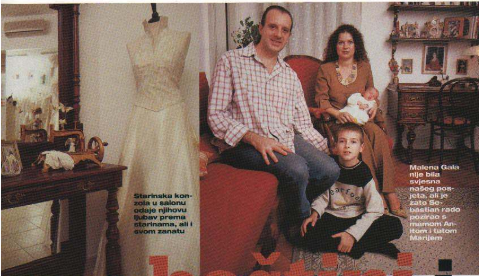
Starinska konzola u salonu odaje njihovu ljubav prema starinama, ali i svom zanatu