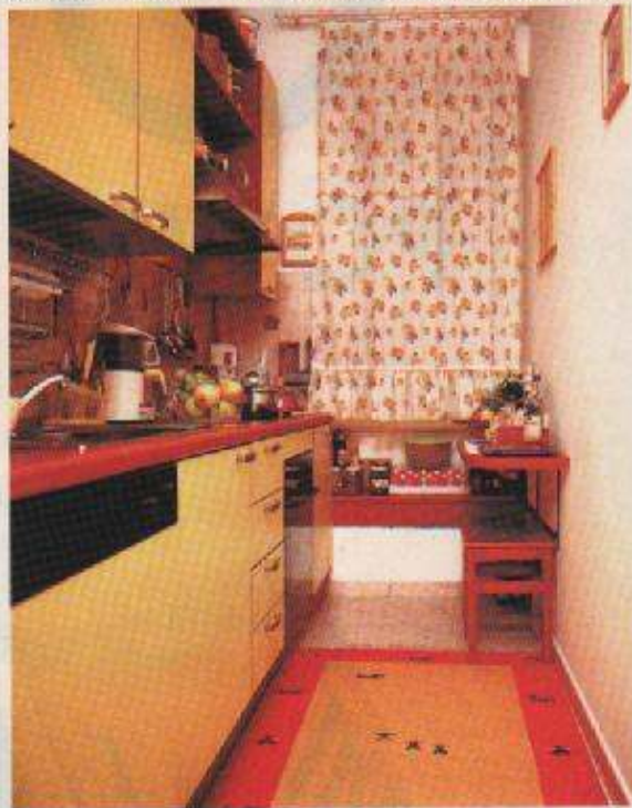
Kuhinja je duguljasta i uska, s "ostavom" u prozorskoj niši i sagom na podu

Soba maloga Sebastiana (a kad malo poraste bit će i Galina, jer već postoje kreveti na kat) tipična je dječja soba u kojoj je sve podređeno