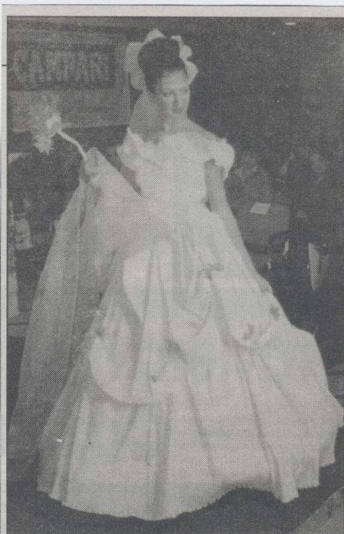
Vjenčanica Jesena — zahvaljujući kojoj je Galićima stigao poziv za Japan — nedavno je u Varaždinu osvojila srebrnu plaketu